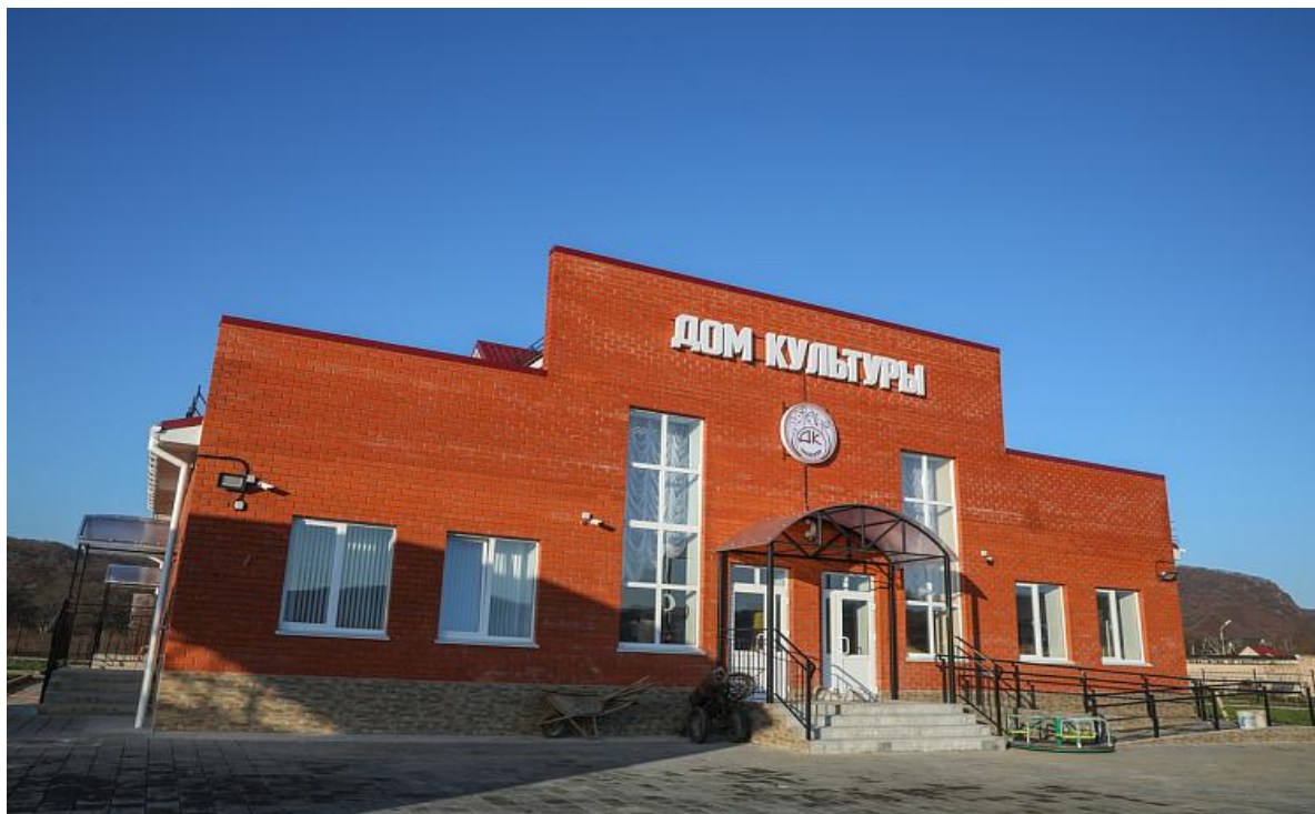
Новый Дом культуры с. Многоудобное

В 2019 году введен в эксплуатацию Дом культуры в с. Многоудобное, который построен в соответствии со всеми требованиями, предусмотренными к строительству данных объектов.