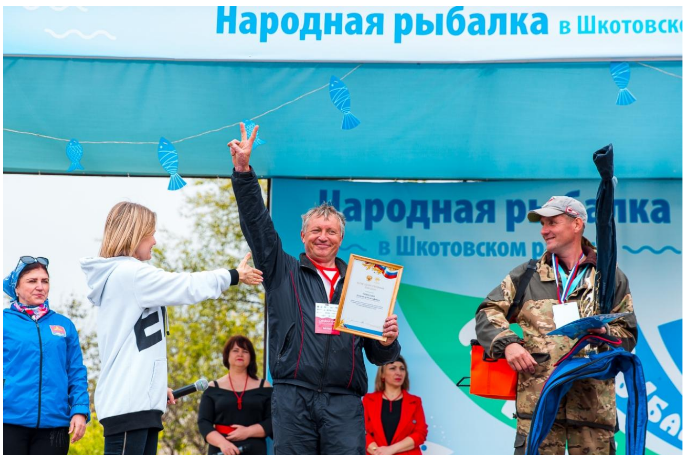
Краевой фестиваль по спортивному лову рыбы «Народная рыбалка», пос. Подъяпольское