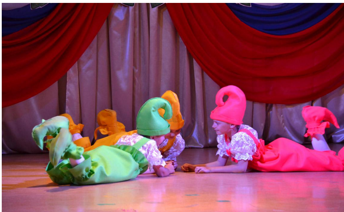
Районный конкурс «Звонкий каблучок»