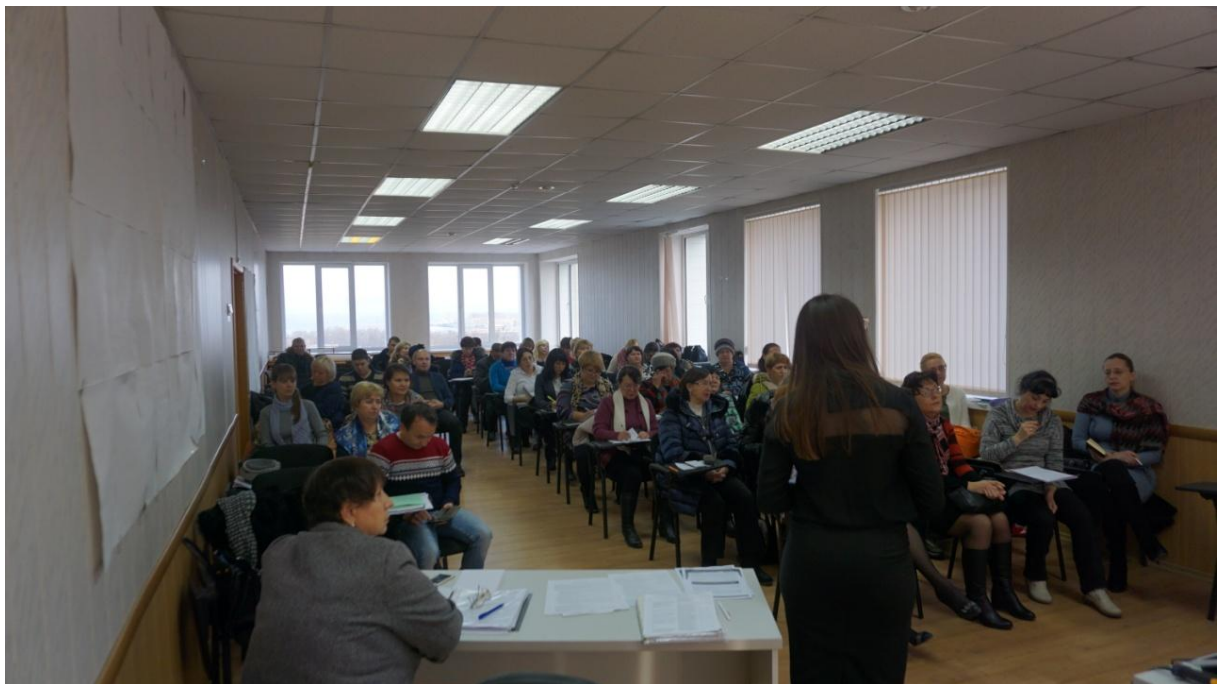
«Обучающие семинары для субъектов малого и среднего предпринимательства»