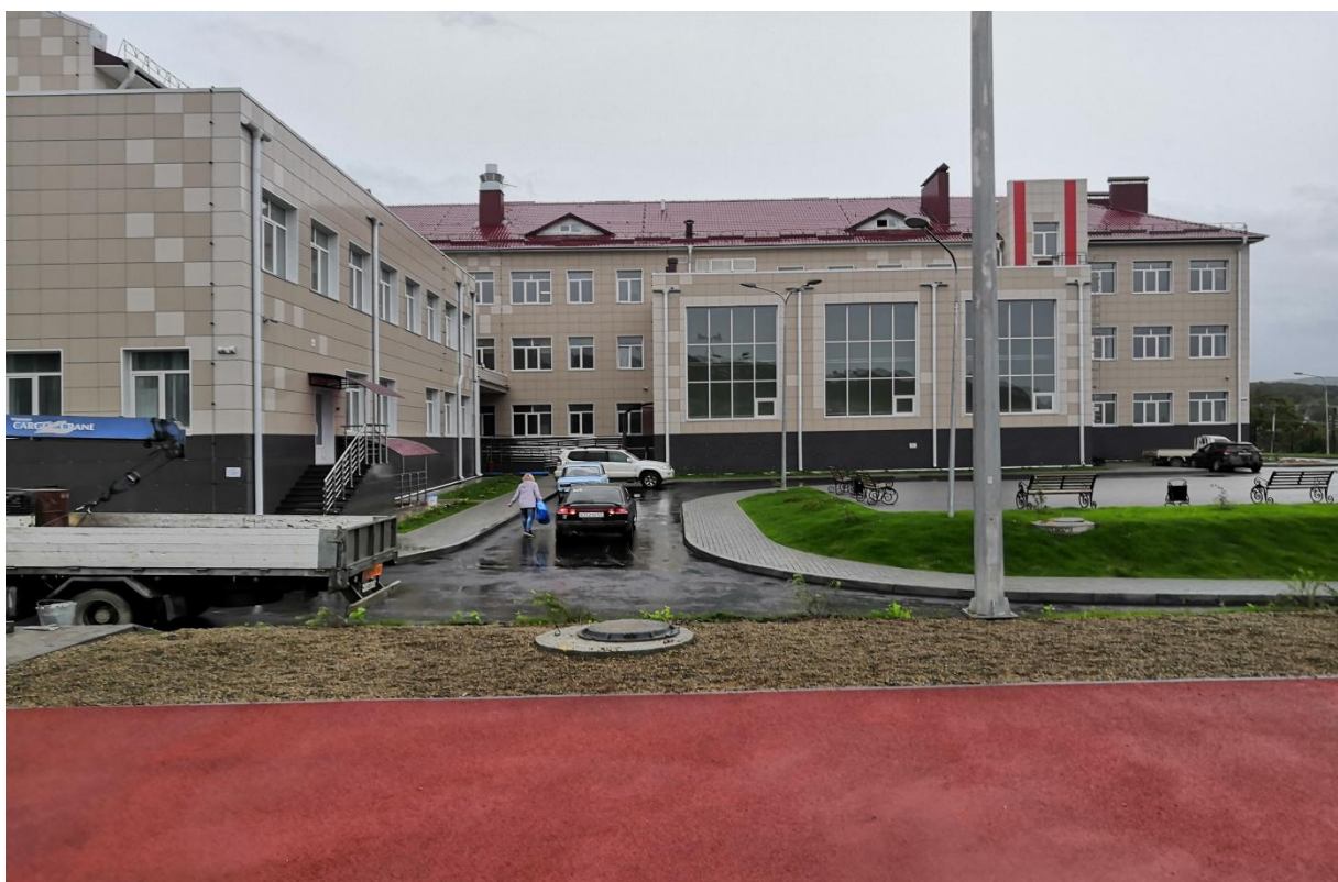
Муниципальное бюджетное общеобразовательное учреждение СОШ № 14 пос. Подъяпольское

В 2020 году введена в эксплуатацию общеобразовательная школа в пос. Подъяпольское на 220 мест.