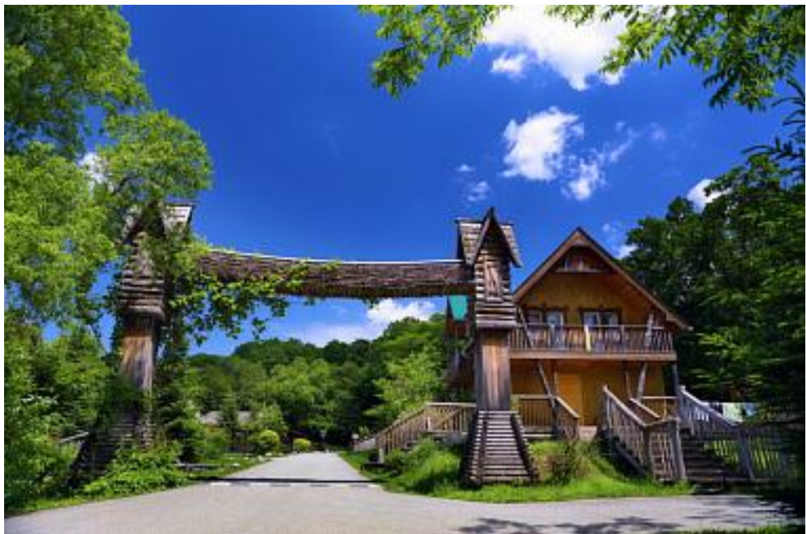
Арт-Парк «Штыковские Пруды», п. Штыково