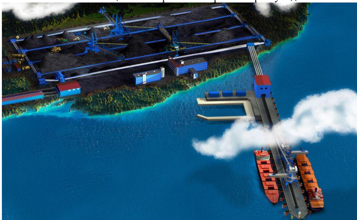
Инвестиционный проект «Угольный морской терминал «Порт Вера»