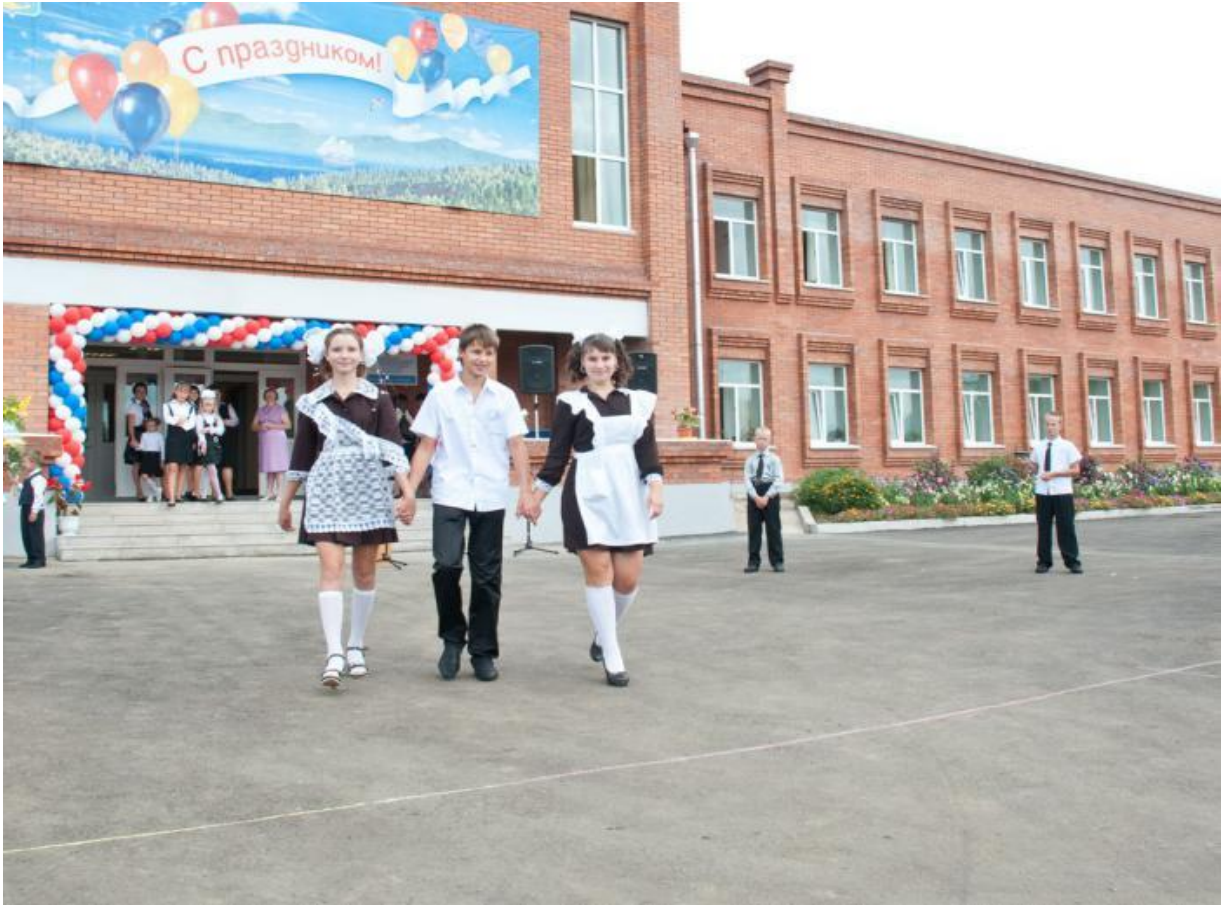
Муниципальное бюджетное общеобразовательное учреждение СОШ № 13 с. Многоудобное