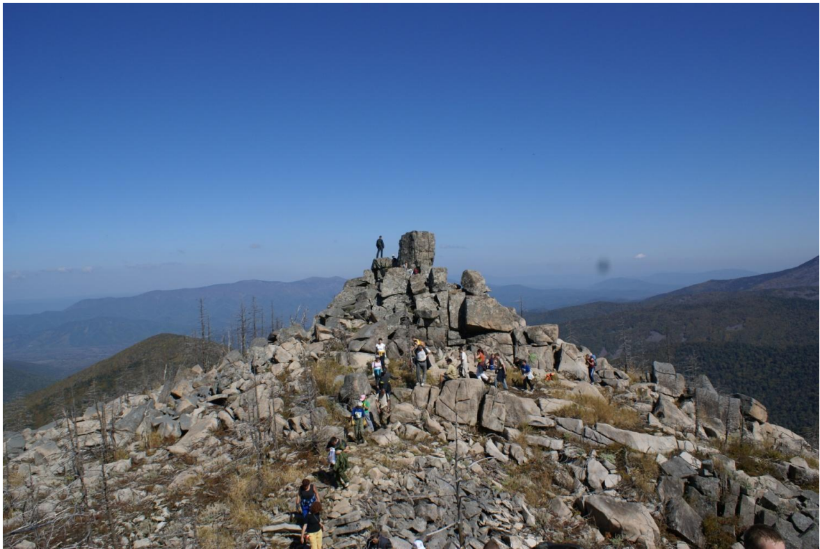
Гора «Пидан», Новонежинское сельское поселение