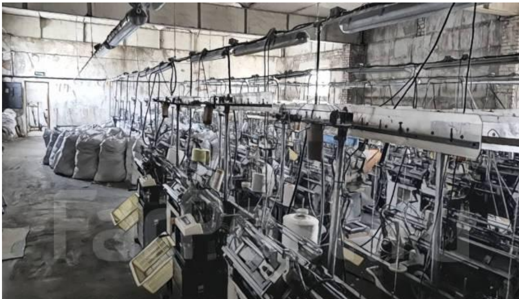
ООО «Палма», пгт Шкотово