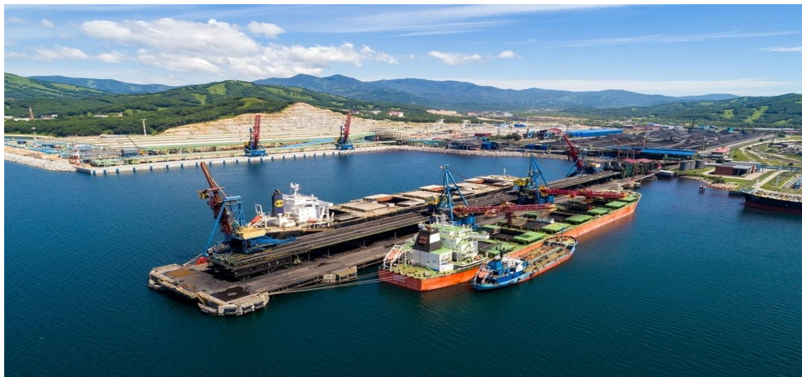
Инвестиционный проект «Морской порт Суходол»

- предоставление консультационной, методической, имущественной и иной поддержки новым инвестиционным проектам.