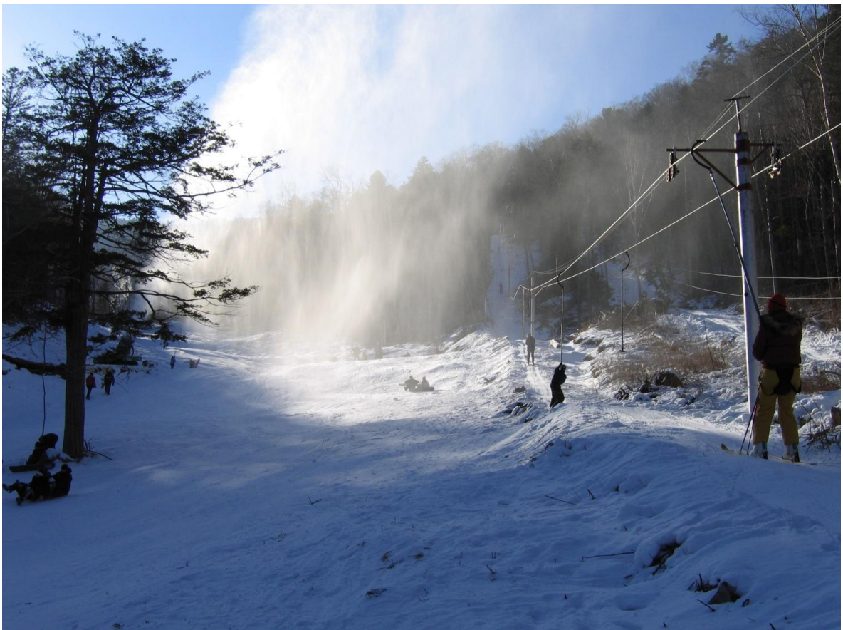
Горнолыжная база «Грибановка», с. Анисимовка