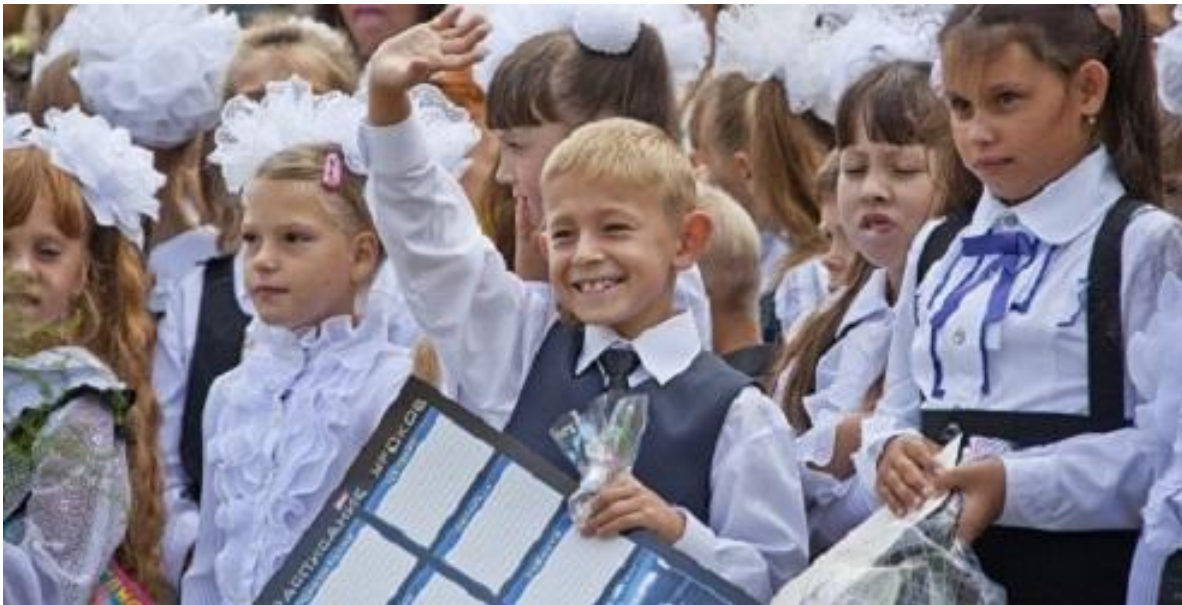
Торжественная линейка, посвященная «Дню знаний» в муниципальном бюджетном общеобразовательном учреждении СОШ № 1 пгт Шкотово