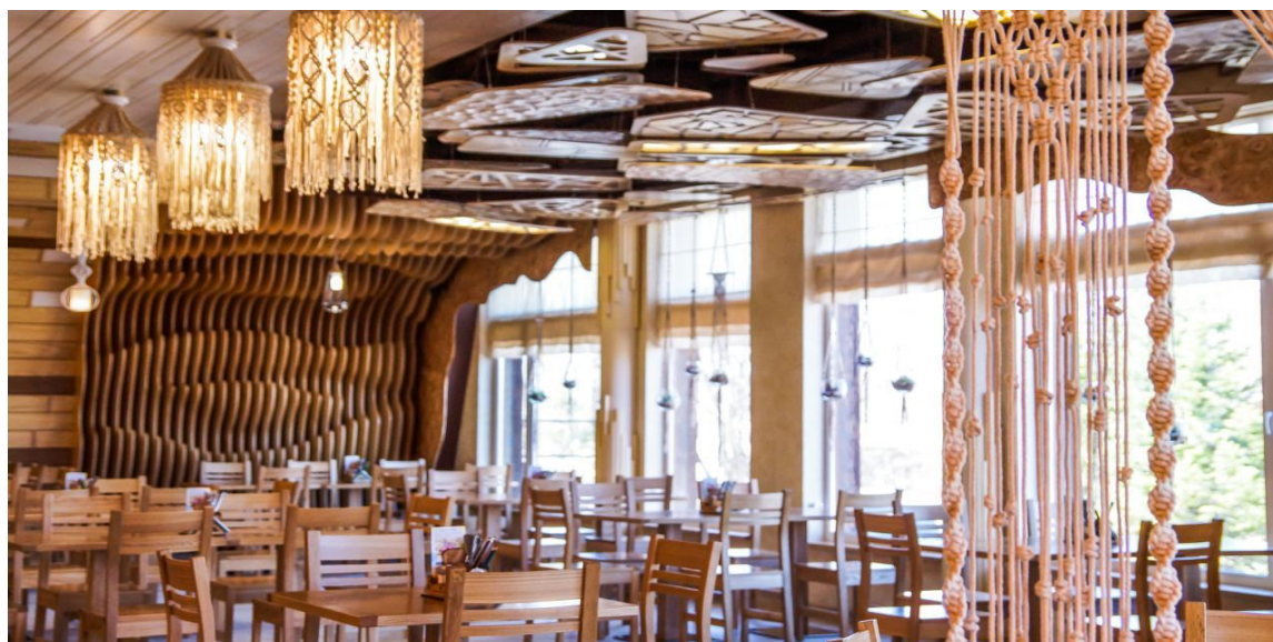
Кафе «Штыковские пруды»

На территории Шкотовского муниципального района функционируют 226 предприятий потребительского рынка, в том числе: розничная торговля: 174, общественное питание: 27, бытовое обслуживание населения: 25.