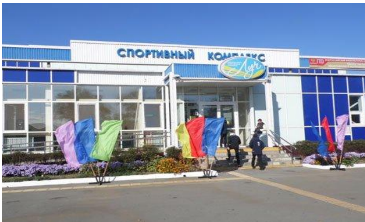
Муниципальное автономное учреждение «Физкультурно-спортивный комплекс «Луч» Шкотовского муниципального района

На территории Шкотовского муниципального района функционируют 226 предприятий потребительского рынка, в том числе: розничная торговля: 174, общественное питание: 27, бытовое обслуживание населения: 25.