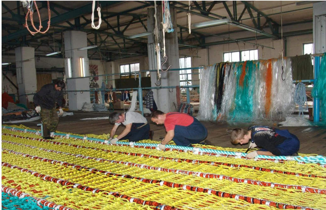
ООО «Фабрика орудий лова», п. Подъяпольское

текстильных изделий, обработка древесины и производство изделий из дерева, производство транспортных средств и оборудования, производство и распределение электроэнергии, газа и воды.