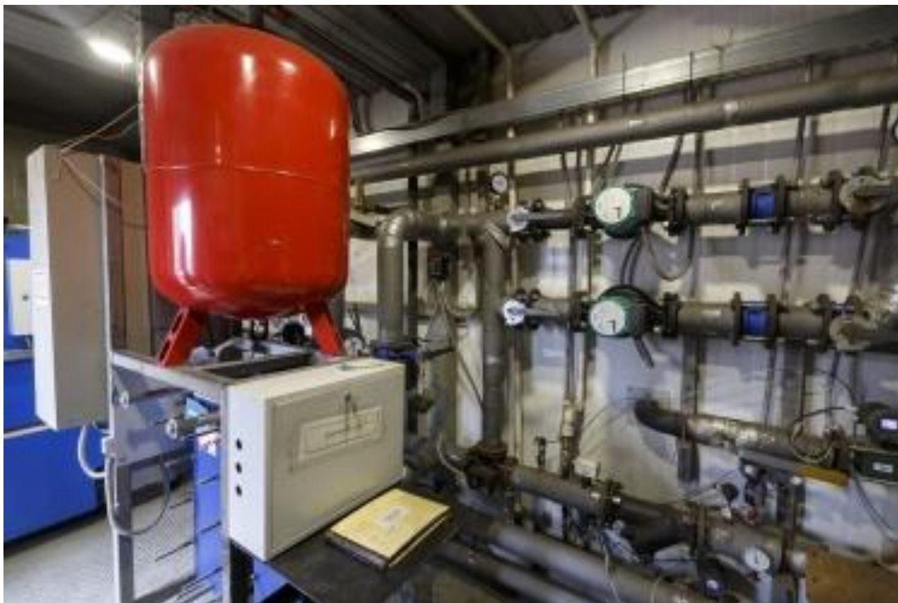
Филиал КГУП «Примтеплоэнерго», пгт Шкотово

Крупнейшими промышленными предприятиями Шкотовского муниципального района являются: