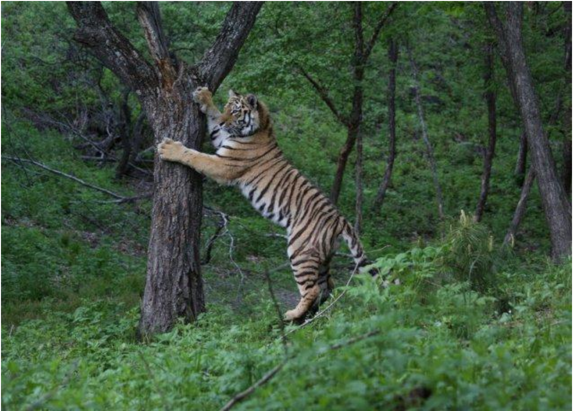
Приморский Сафари – Парк, пгт Шкотово